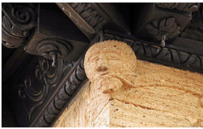
Mono Casa Guijarro