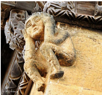
Mona Casa Aliaga

El portal de San Pablo es una antigua puerta de las cinco con las que contó la muralla que cerraba la Villa. Todavía conserva los goznes para insertar los batientes de madera. En la cara intramuros de este portal de San Pablo se observa la hornacina entre pilastras con la imagen del Apóstol. "S. PABLO A. AÑO 1721".